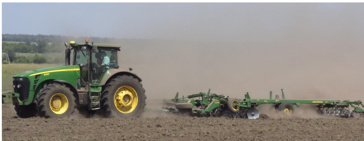
Рис. 2 – Загальний вигляд ґрунтообробного агрегату John Deere 8430 + John Deere 637