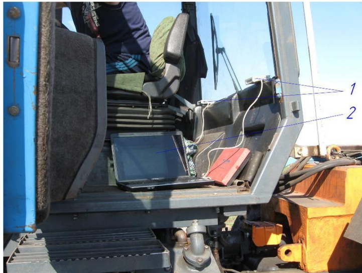
Рис. 1 – Розміщення вимірювально-реєстраційного комплексу в кабіні трактора 1 – датчики прискорень; 2 – ПК для зняття та архівації даних

Даний комплекс використовується для визначення тягово-динамічних властивостей. У теперішній час всі світові лідери по виробництву тракторів, сільгоспмашин (John Deere, Claas, Case IH та ін.) комплектують свою техніку навігаційною системою GPS. Дана система затребувана у зв'язку з тим, що забезпечує економію коштів. У Європі, наприклад, підраховано, що економічний ефект від застосування GPS-обладнання досягає 50-60 євро на гектар. Крім цього, користувач даного обладнання отримує можливість проводити польові роботи вночі, в тумані, при підвищеній запиленості і т.д.